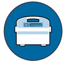
Indicadores de filtro lleno y retardo de operación