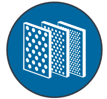
3 opciones de filtrado