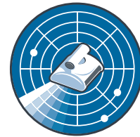
Sistema de escaneo CleverClean™