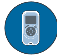
Unidad de control remoto