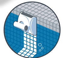
Limpieza de la Línea de Flotación