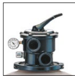
Arena fácilmente accesible gracias al collarín de desmontaje