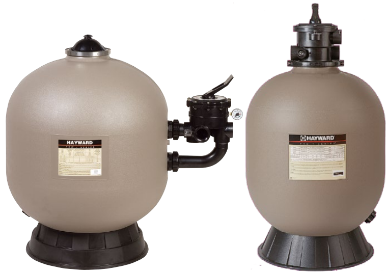
ProSeries™ HB Side