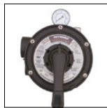
Válvula Vari-Flo™ 6 posiciones