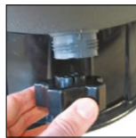
Tubo de desagüe con su tapón, de gran dimensión que sirve como herramienta de desmontaje